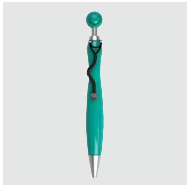
BOL 02 Bolígrafo Doctors