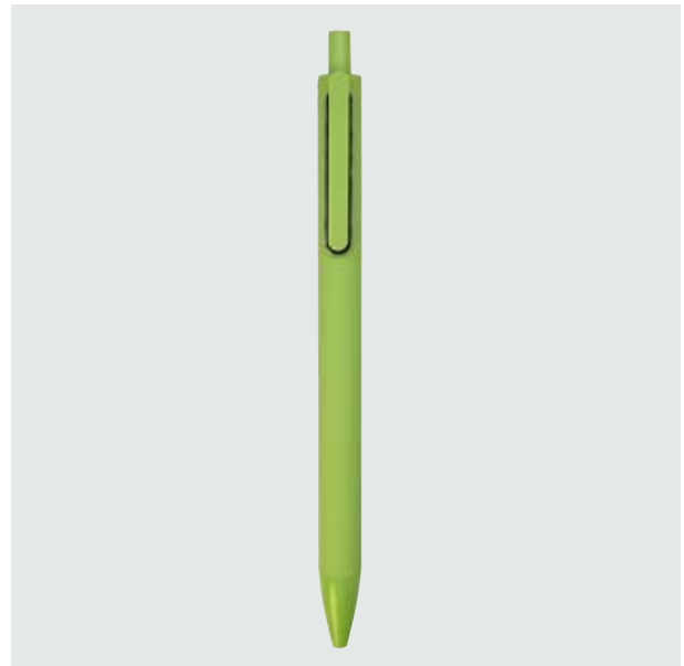
BOL 14 Bolígrafo Angélico