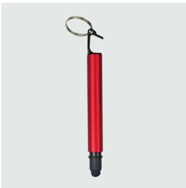
BOL 239 Bolígrafo Turrell