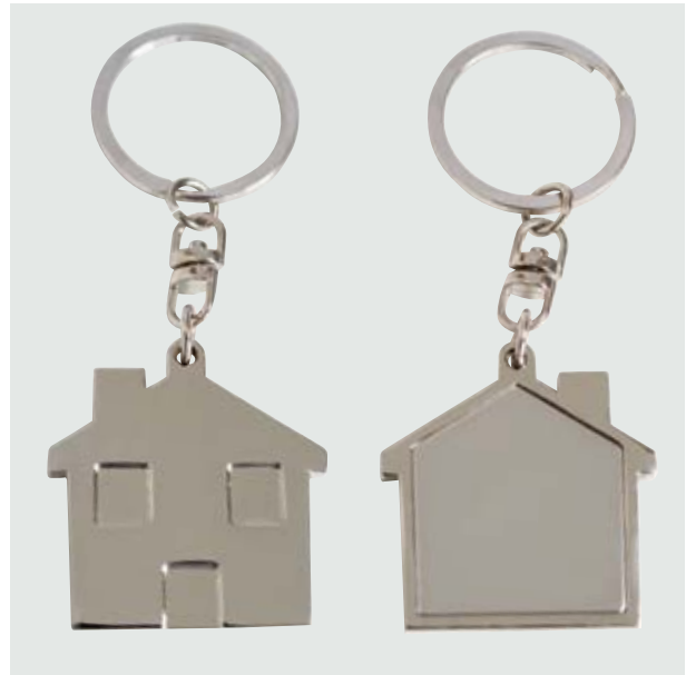
LLA 29 Llaverero Forma Casa