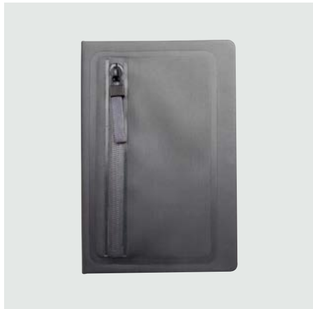
ESC 536 Libreta Denver