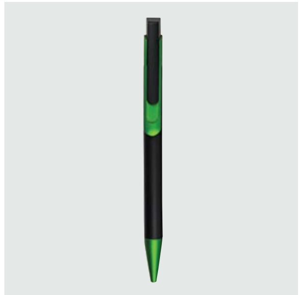
BOL 107 Bolígrafo Tintoretto