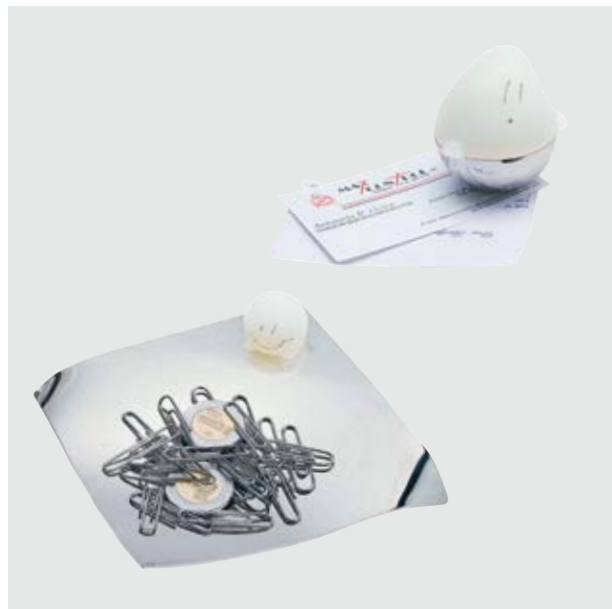
ESC 590 Set Fantasma