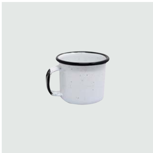
TH 212 Shot-Tequilero