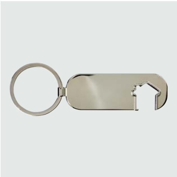
LLA 28 Llaverero Ranura-Casa